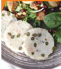
Ветчина рыбная с кальмарами