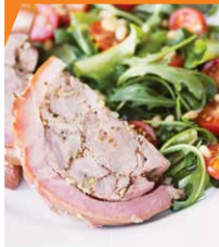
Рулет деликатесный из свинины