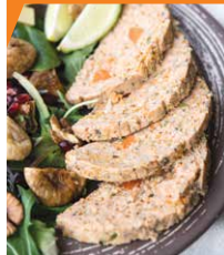
Ветчина из лосося с кальмарами