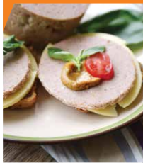
Колбаса домашняя «Докторская»