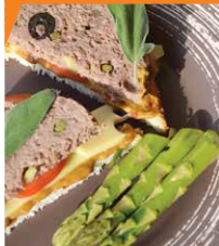
Ветчина из телятины со спаржей