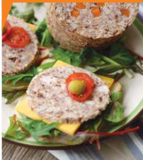
Ветчина из индейки с куриными сердечками