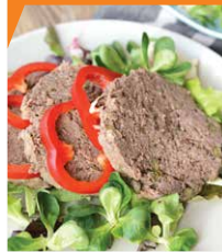
Ветчина из свиного языка с каперсами