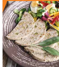
Ветчина из индейки с грибами