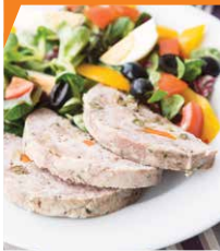
Ветчина из свинины и индейки с каперсами