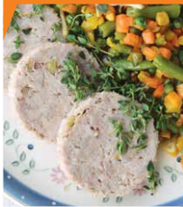
Ветчина из свинины с индейкой и грибами