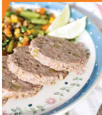
Ветчина из говядины и судака