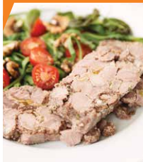
Ветчина из говядины со сливками