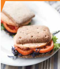
Ветчина рыбная с креветками