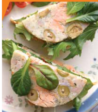
Ветчина рыбная с креветками и оливками