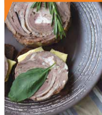
Рулет из свиного языка