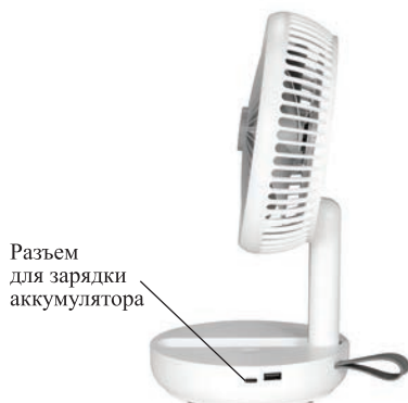
Разъем для зарядки аккумулятора